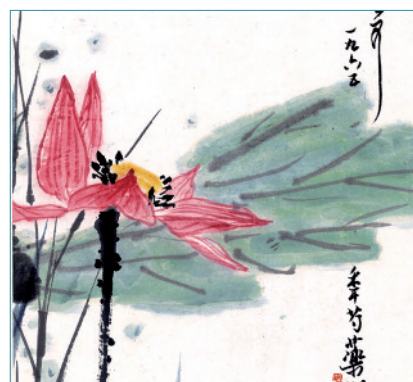
Pan Tian Shou (1897-1971)

Les fibres très particulières du papier Xuanzhi restituent toutes les traces qu'y laissent l'eau et les couleurs contenues dans les poils du pinceau. Cela permet d'illustrer parfaitement toutes les caractéristiques de ce que l'on souhaite représenter : l'humide ou le sec, l'épais ou le fin, le sombre ou le clair, etc.