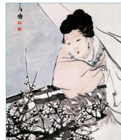
Ren Bo Nian (1840-1896)

En ajustant les quantités d'eau et de couleurs contenues dans le pinceau, nous commencerons à dessiner des formes complexes pour peindre d'un seul trait de pinceau rochers, vagues, plumes, pétales, fruits, etc... tout en exprimant les justes proportions, couleurs, lumière et perspectives.